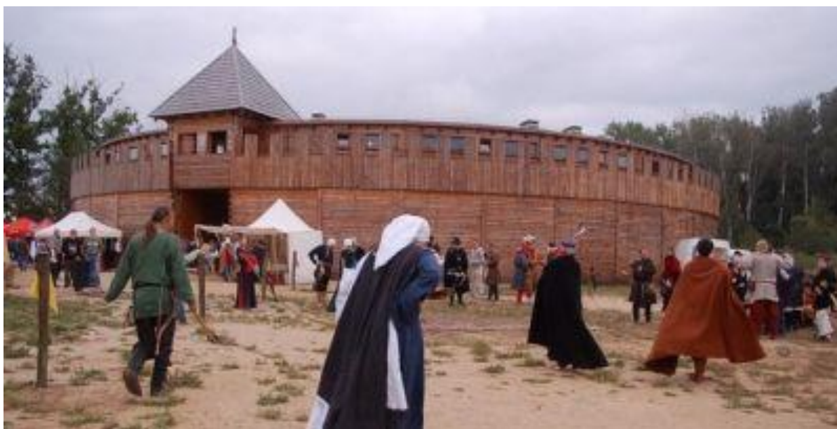
Replika Grodu średniowiecznego w Biskupicach w gminie Byczyna